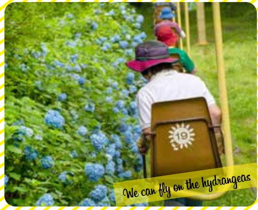
We can fly on the hydrangeas