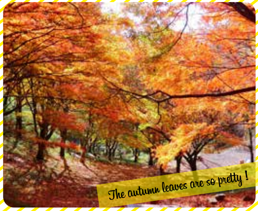
The autumn leaves are so pretty!

※花や自然の状況はその年の天候などによって変わります。あらかじめご了承ください。