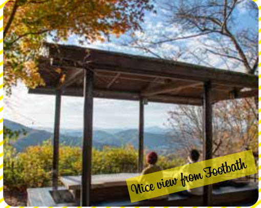
Nice view from Footbath