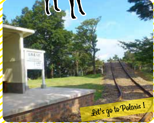
Let's go to Polaris!