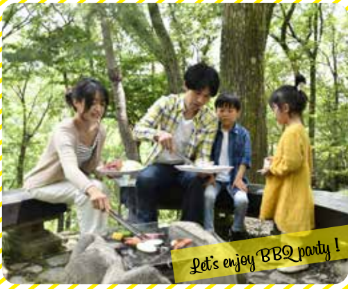
Let's enjoy BBQ party!