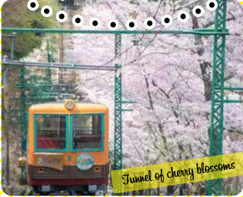
Tunnel of cherry blossoms